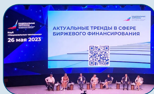
Заседание Клуба «Национальных чемпионов» на тему «Актуальные тренды биржевого финансирования» 26.05.2023